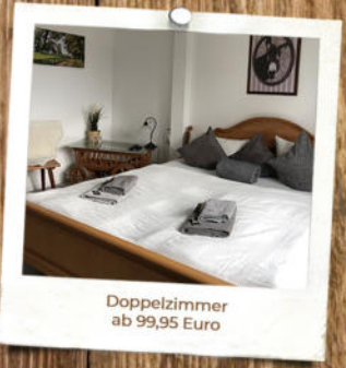
Doppelzimmer ab 99,95 Euro