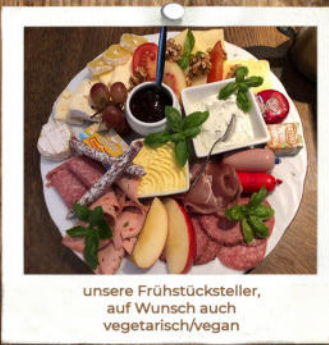
unsere Frühstücksteller, auf Wunsch auch vegetarisch/vegan