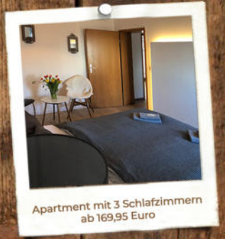
Apartment mit 3 Schlafzimmern ab 169,95 Euro