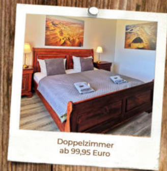
Doppelzimmer ab 99,95 Euro