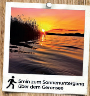
5min zum Sonnenuntergang über dem Geronsee

Strelitzer Str. 13 16775 Gransee landlusthotel.de info@landlusthotel.de