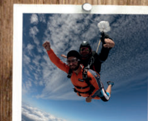
Fallschirmspringen goJump 5 MIN