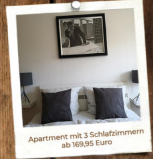
Apartment mit 3 Schlafzimmern ab 169,95 Euro