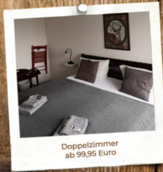
Doppelzimmer ab 99,95 Euro