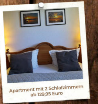
Apartment mit 2 Schlafzimmern ab 129,95 Euro