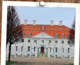
Schloss Meseberg 10 MIN