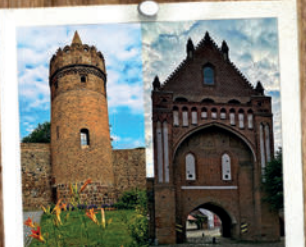
Pulverturm Ruppiner Tor 20 MIN