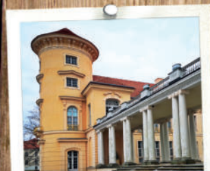
Schloss Rheinsberg 30 MIN