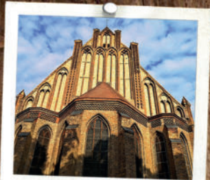
St. Marienkirche 10 MIN