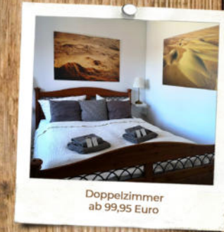
Doppelzimmer ab 99,95 Euro