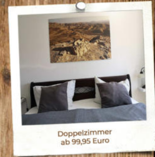
Doppelzimmer ab 99,95 Euro