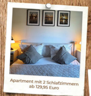
Apartment mit 2 Schlafzimmern ab 129,95 Euro