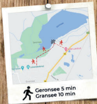
Geronsee 5 min Gransee 10 min