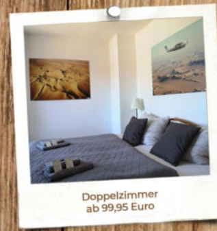
Doppelzimmer ab 99,95 Euro