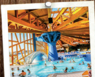
NaturTherme Templin 30 MIN