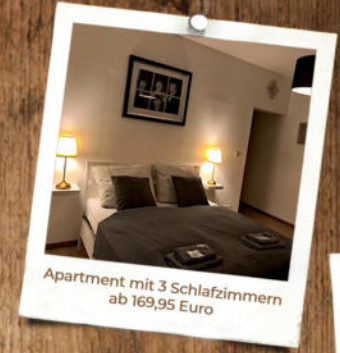
Apartment mit 3 Schlafzimmern ab 169,95 Euro