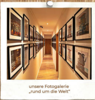
unsere Fotogalerie „rund um die Welt“