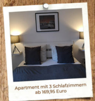
Apartment mit 3 Schlafzimmern ab 169,95 Euro