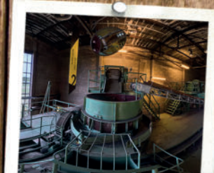
Ziegeleipark Mildenberg 15 MIN